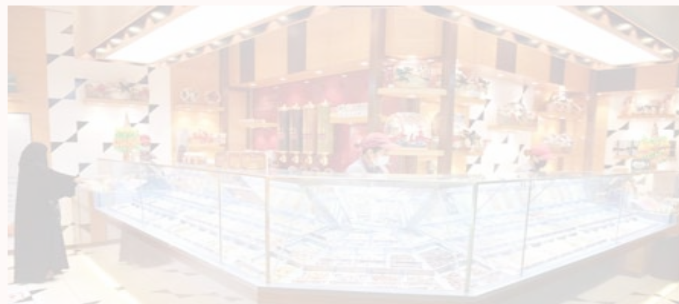
«الرفاعي» يجمعنا، حملة المحمصة خلال شهر رمضان