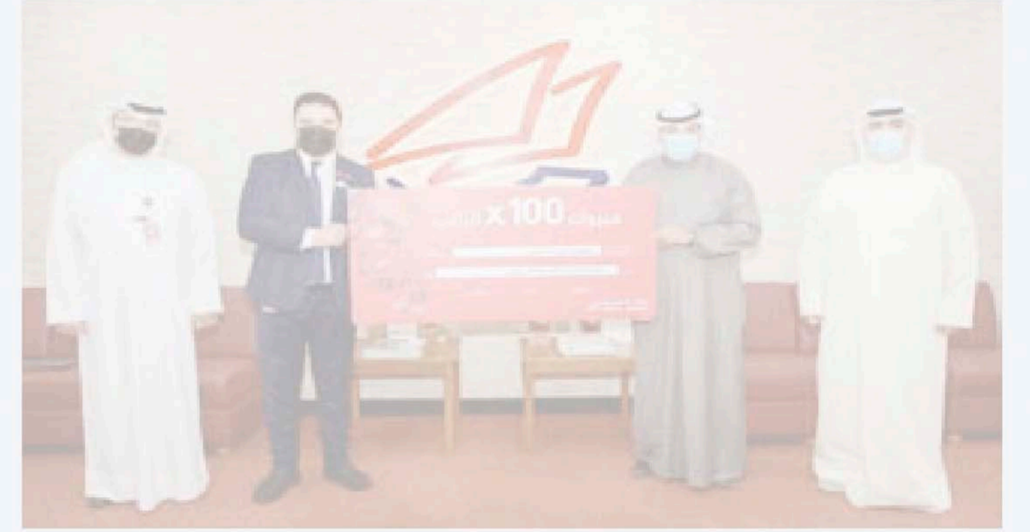
الفائز بسحب الراتب مع فريق «الخليج»