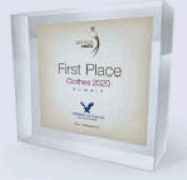
جائزة «أمريكان إيجل»

ومنحت لجنة التحكيم «زين» المركز الأول في فئة قطاع الاتصالات لنجاحها في تحقيق أعلى معدلات