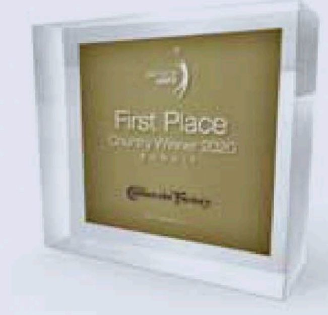
وأفضل مزود خدمة