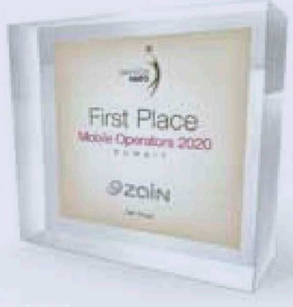
جائزة «سيرفيس هيرو» لـ«زين»

وفي أواخر العام الماضي، حصلت «زين» جائزة «أسرع إنترنت منزلي في الكويت» عن الربع الأول والثاني من عام 2020 من Ookla Speedtest، الشركة الرائدة عالمياً والأكثر شفافية في تطبيقات اختبار وتحليل سرعات شبكات الإنترنت حول العالم، وهي الجائزة التي عكست جهودها في تقديم شبكة 5G الأكبر والأقوى في الكويت، وذلك مُنذ فوزها في شهر يونيو 2019 بإطلاقها التجاري لتكنولوجيا الجيل الخامس كاول شركة تطرح هذه التقنية المتطورة في الخليج عبر السوق الكويتي، وبتغطية شاملة لكافة مناطق البلاد، حيث نجحت في تصميم وبناء أول شبكة كاملة لخدمات الجيل الخامس، مع توفير بنية تحتية وفق أفضل المعايير الدولية، مما شكّل نقلة نوعية في تطوير قطاع الاتصالات في الدولة والمنطقة.