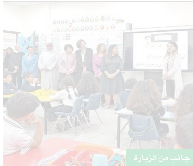
جانب من الزيارة

● في زيارة للإدارة التنفيذية للبنك ومسؤولي وزارة التربية و«نزاهة» لمدرسة البيان ثنائية اللغة ● الفليج: تطوير التعليم والشمول المالي يستلزمان تضافر جهود الحكومة والقطاع الخاص والمجتمع المدني