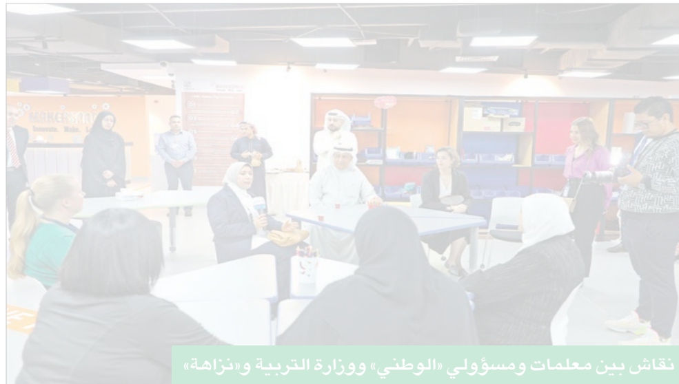
نقاش بين معلمات ومسؤولي «الوطني» ووزارة التربية و«نزاهة»